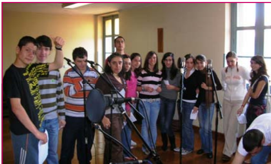
Grabando "Nacido@s para algo grande"

El domingo 20 de mayo celebramos en nuestra comunidad parroquial el día de la Creación. Ya llevamos un tiempo trabajando la sensibilización y el estudio de una de las cuestiones más acuciantes para nuestro mundo: la ecología. Pero lo hacemos desde la perspectiva de la fe, integrando la cosmovisión cristiana y la exigencia de la justicia intergeneracional. Pensamos que un buen día para celebrarlo era la Ascensión de Jesús.