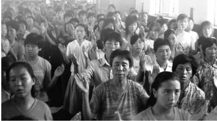
La Eucaristía sostiene nuestras vidas pero también necesitamos una educación continua no solo como discípulos de Jesús sino como seres humanos hijos e hijas de Dios.

No olvidemos que ya antes los misioneros claretianos en China han emprendido la obra de la impresión de la Biblia en chino, un hecho que, a la vez de estar en el espíritu de la misión evangélica de nuestro fundador, también ayuda muchísimo en traer la palabra a la gente china.