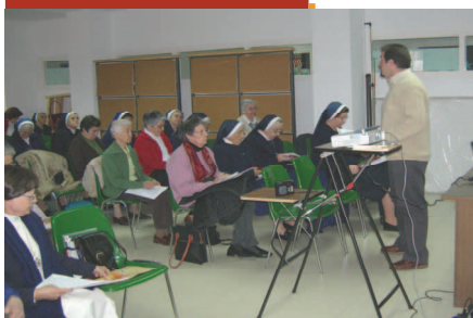
El Equipo con las Misioneras Concepcionistas