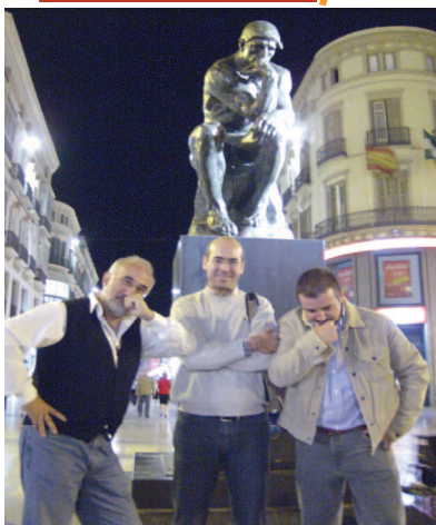
El Equipo a los pies del original "Pensador" de Rodín (expuesto en Málaga)

Para llegar a ser equipos eficaces y no francotiradores y "llaneros solitarios" necesitamos convivir, dialogar y discernir; orar y trabajar juntos.