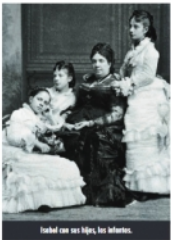
Isabel con sus hijos, los infantes.

H abíamos dejado al arzobispo Antonio María Claret en Medina de Rioseco acompañando a Isabel II en 1851. Así lo describe el Libro Becero del convento de San José de las madres carmelitas descalzas de aquella localidad: "nos dijo la Misa, un buen rato pasó al locutorio, tomó chocolate, llamó a la Comunidad, nos quedamos admiradas de ver a aquella persona tan venerable su rostro de un santo y su palmar del cielo". Las moradas le podían darse pronto en Medina de Rioseco con sus misioneros, "que no nos amargáramos con las curas para nuestra dirección y nos respondieron: si, si, tened paciencia que yo vendré". Cuando conoció la iglesia muy deteriorada del antiguo templo de los dominicos, dice la tradición que el padre Claret pronunció que allí predicar en su día sus misioneros y allí, llegaron en julio de 1854, veinticuatro años después de su muerte. Pasó después de las carmelitas a las claustrales. Después de la plática le entregó la media y cada una de recuerdo. A la vuelta de aquel verano se detuvieron en Tordesillas, un 17 de septiembre, procedentes de Benavente.