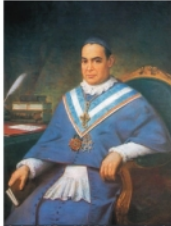
San Antonio María Claret, de left. Pintura, encargada por la Reina Isabel II de Borbón.

"Era la hora en Vic de crear un instituto misionero llamado Hijos del Inmaculado Corazón de María, aunque su nombramiento como arzobispo de Cuba interrumpió su dedicación"