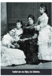
Íntimo con sus hijos, los infantes.

H abíamos dejado al arzobispo Antonio María Claret en Medina de Rioseco acompañando a Isabel II en 1858. Así lo describe el Libro Becero del convento de San José de las madres carmelitas descalzas de aquella localidad: "nos dijo la Mesa, un buen rato pasó al locutorio, tomó chocolate, llamó a la Comunidad, nos quedamos admiradas de ver a aquella persona tan venerable su rostro de un santo y su palmar del cielo". Las moradas se pudieran establecer pronto en Medina de Rioseco con sus misioneros, "que no nos arreglábamos con las curas para nuestra dirección y nos respondieron: si, si, tened paciencia que yo vendré". Cuando conoció la iglesia muy deteriorada del antiguo templo de los dominicos, dice la tradición que el padre Claret pronunció que allí predicar en su día sus misioneros y allí, llegaron en julio de 1854, veinticuatro años después de su muerte. Pasó después de las carmelitas a las claustrales. Después de la plática en la media y establecida una de recuerdo. A la vuelta de aquel verano se detuvieron en Tordesillas, un 17 de septiembre, procedentes de Benavente.